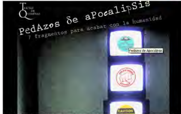
La obra es dirigida en cada uno de sus fragmentos por siete diferentes directores. ESPECIAL /

CUADRO DE MÉXICO (10/ABR/2011). - La pieza teatral 'Pedazos de Apocalipsis' de Martín López Brie, quien ofrece siete ideas o fragmentos para acabar con la humanidad, inició temporada la víspera bajo una atinada dirección múltiple.