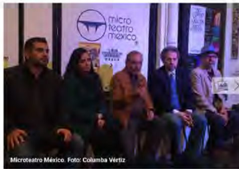
Microteatro México.